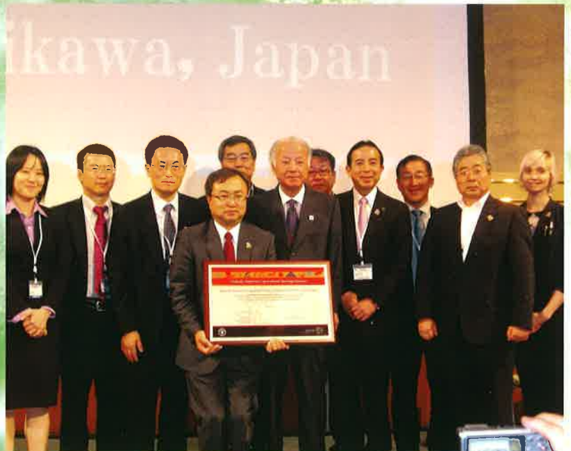
認定式(石川県七尾市)