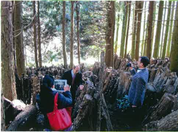
FAOと国連大学の事前調査(2月24日)