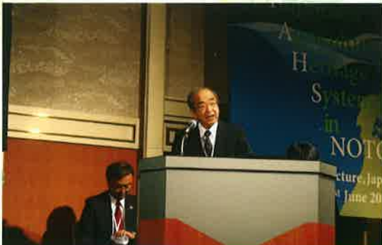
サイトプレゼンテーション