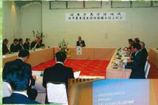
推進協議会 設立総会 (4月13日)