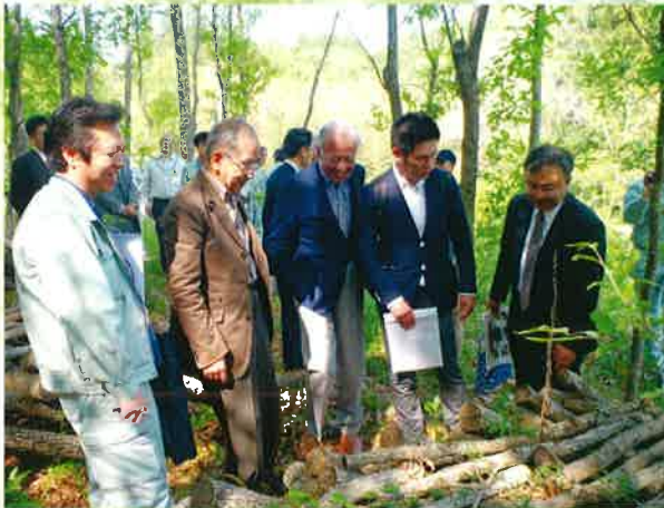
国連大学現地調査(5月4日)