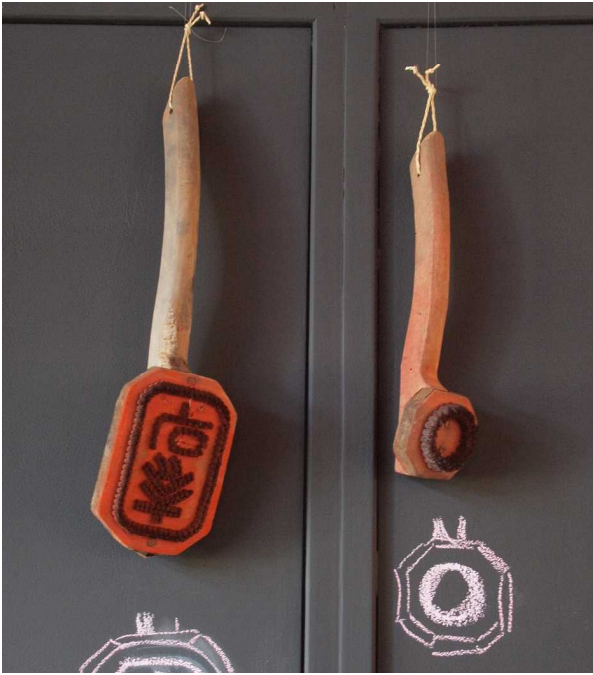
0077 大分県検査印判(朱毛判) 「墨丸長方形に大分県の字」 0078 検査印判(朱毛判) 「丸」