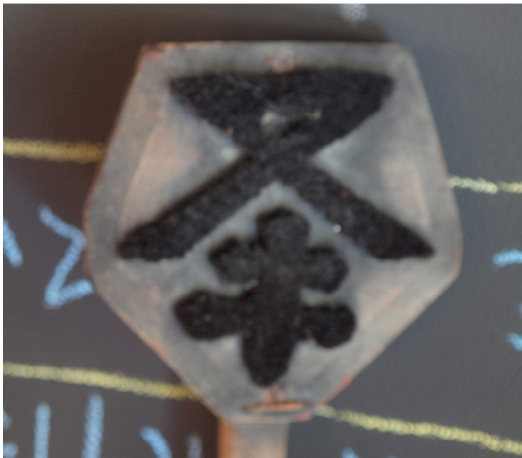
0081 筵問屋印判(毛判) 「又にキの字」