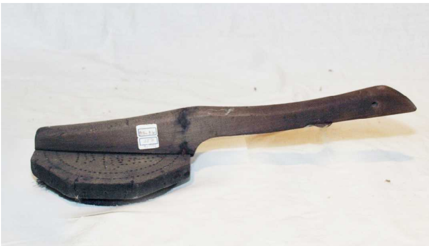
0063 筵問屋印判(毛判) 「丸に吉の字」