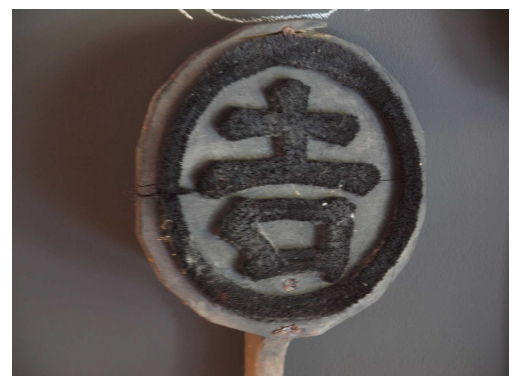
0080 筵問屋印判(毛判) 「丸に吉の字」