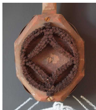
0079 検査印判(朱毛判) 「丸に内接円弧」