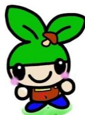
大分県森林づくりマスコットキャラクター 「しいたけもりりん」

応援商品 とは国東半島宇佐地域 世界農業遺産シンボルマークと応援 メッセージを商品に表示していただき、 世界農業遺産の認知度向上に協力して いただくものです。